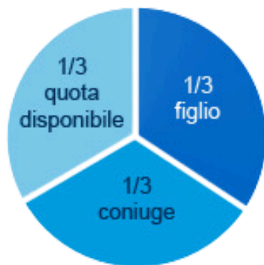
coniuge e un figlio