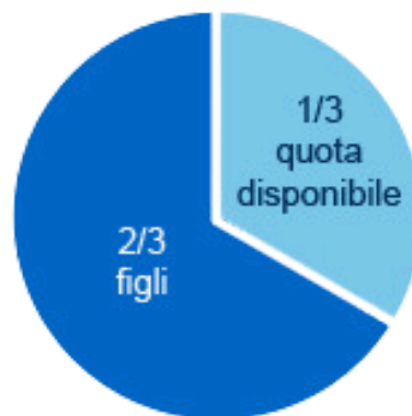
due o più figli