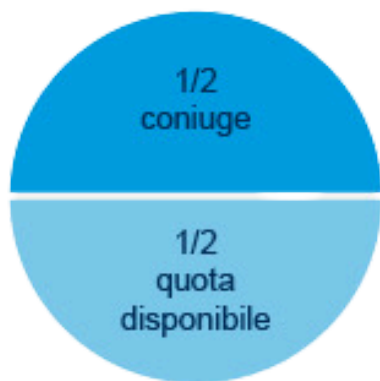
solo il coniuge