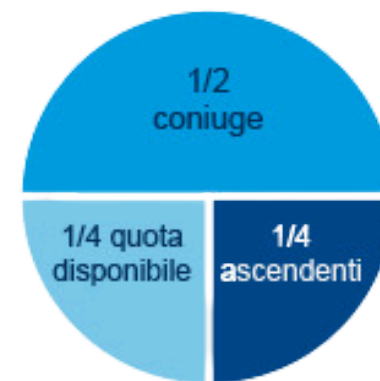
coniuge e ascendenti