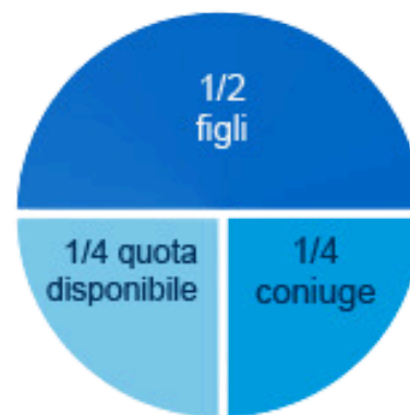
coniuge e più figli