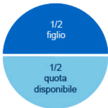
solo un figlio